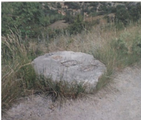
Base antigua del Peirón.

Diferentes fotografías anteriores al año 2007: