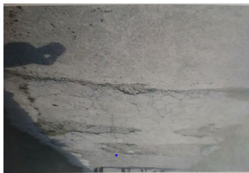
Una muestra del estado del suelo del camino a la Ermita