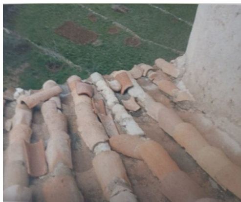
Parte deteriorada del tejado de la Ermita.